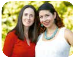
사진 바크라브 미드릴